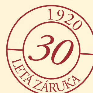
Image Vaší Střechy