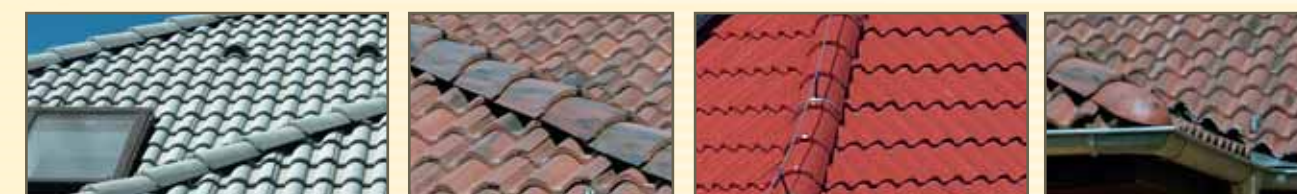
Image Vaší Střechy