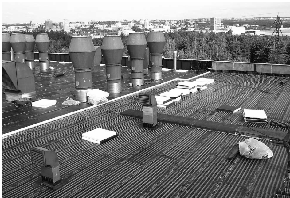
Rozpracovaná střecha s parozábranou Bauder-THERM DS2

Při navrhování nových i rekonstrukčních stávajících střešních pláštů občanských a průmyslových staveb je nutno vždy přihlídnout k očekávané životnosti objektu jako celku a zvážit i případnou změnu v jeho využití. Proto by měl být navržen i střešní plášť univerzálně tak, aby splňoval požadované parametry interiéru, objektu i při změně jeho využití nejen z hlediska požadované hodnoty součinitele prostupu tepla U , ale i z hlediska difuze vodní páry (střechu hal s skladovacího objektu může být proto někdy výhodné navrhnout i pro případné využití objektu jako prodejní halu nebo mechanickou dílnu, apod.).