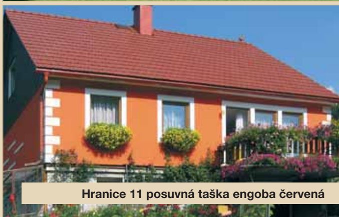
Hranice 11 posuvná taška engoba červená