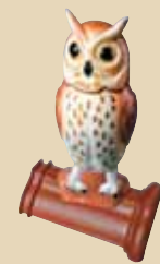
Kalous na hřebenáči č. 2