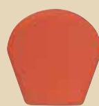
Ukončení hřebenáče spodní k hřebenáči č. 7