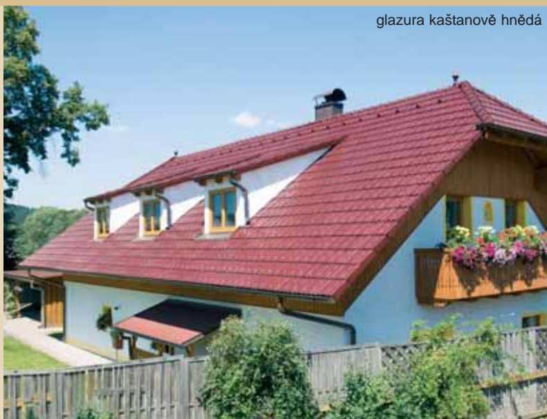
glazura kaštanově hnědá