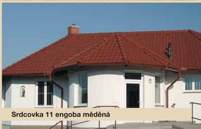
Srdcovka 11 engoba měděná