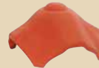
Rozdělovací hřebenáč X k hřebenáči č. 2