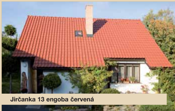
Jirčanka 13 engoba červená