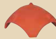
Rozdělovací hřebenáč valbový k větracímu hřebenáči č. 4