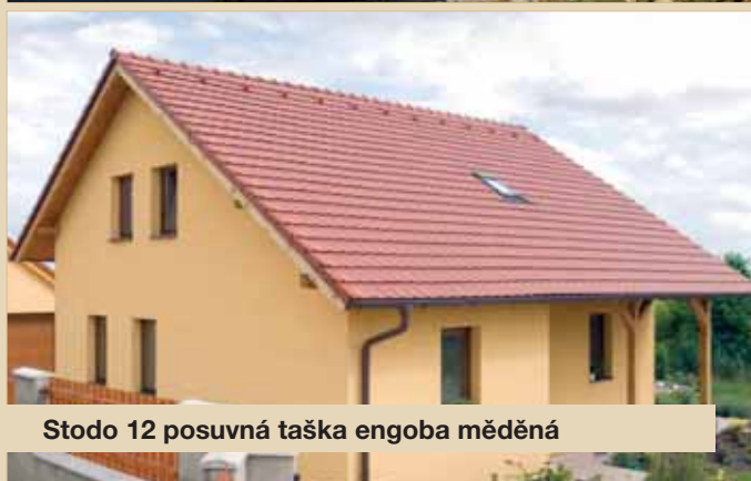
Stodo 12 posuvná taška engoba měděná