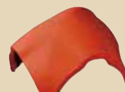
Rozdělovací hřebenáč valbový k hřebenáči č. 2