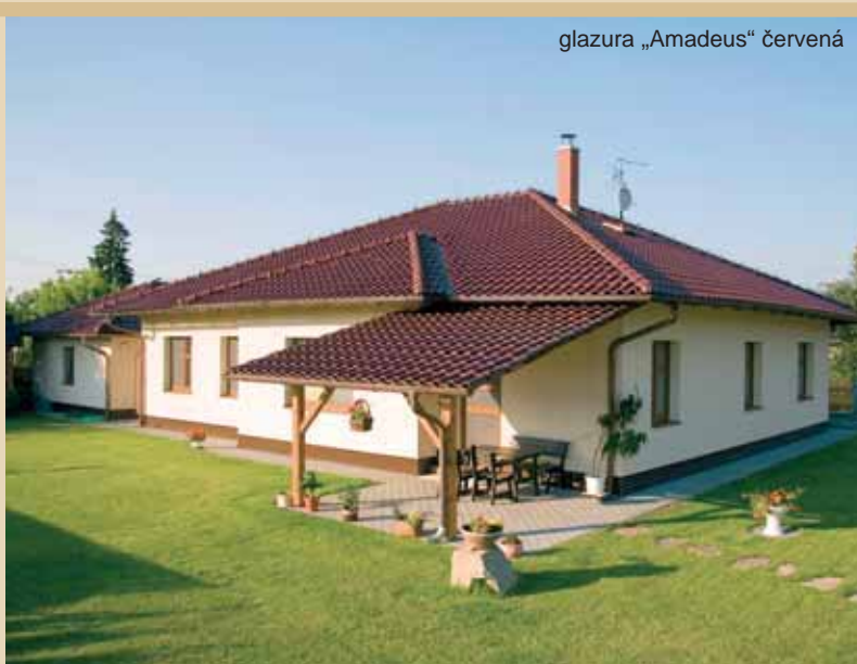
glazura „Amadeus“ červená

Při mezní krycí délce 360–370 mm nelze použít okrajové tašky bez úprav.