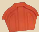
Ukončení hřebenáče vrchní k hřebenáči č. 3