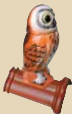
Sova na hřebenáči č. 2