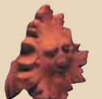
Slunce ukončení hřebene k hřebenáči č. 2