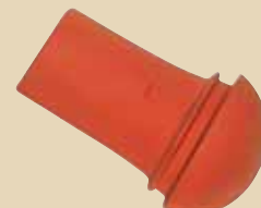
Ukončení hřebenáče nárožní dlouhé k hřebenáči č. 7