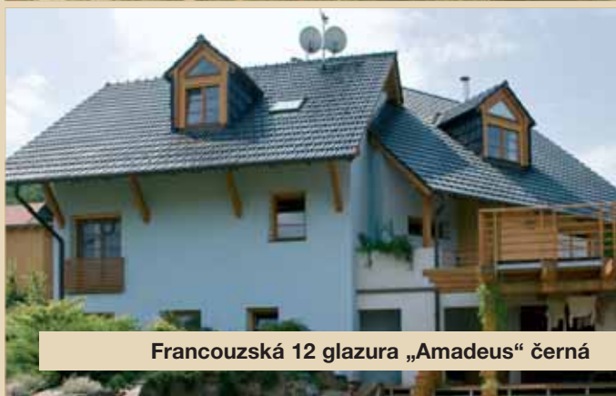
Francouzská 12 glazura „Amadeus“ černá