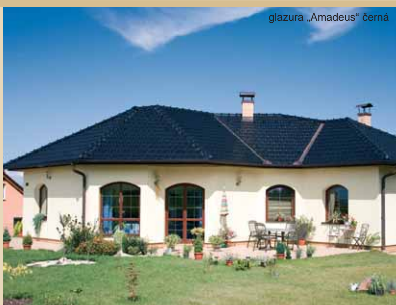
glazura „Amadeus“ černá