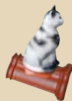
Kočka na hřebenáči č. 2