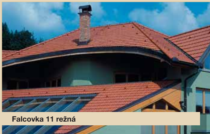
Falcovka 11 režná