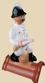
Hasič na hřebenáči č. 2