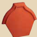
Ukončení hřebenáče vrchní k hřebenáči č. 2