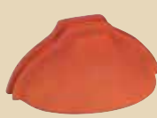
Ukončení hřebenáče nárožní k hřebenáči č. 3