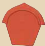
Ukončení hřebenáče vrchní k hřebenáči č. 7