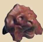
Lev ukončení hřebene k hřebenáči č. 2