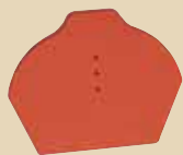
Ukončení hřebenáče spodní k hřebenáči č. 2