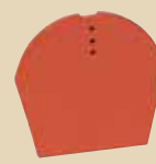
Ukončení hřebenáče spodní k hřebenáči č. 4