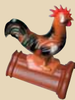
Kohout na hřebenáči č. 2