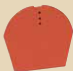
Ukončení hřebenáče spodní k hřebenáči č. 5