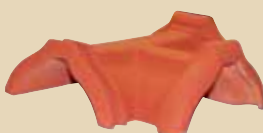
Rozdělovací hřebenáč T k hřebenáči č. 2