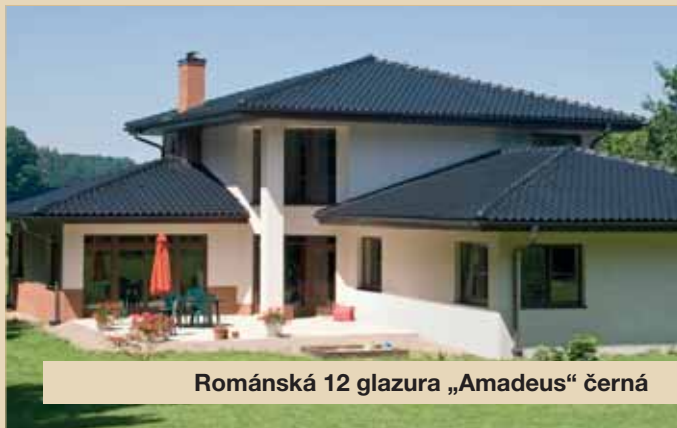
Románská 12 glazura „Amadeus“ černá