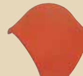
Rozdělovací hřebenáč valbový k hřebenáči č. 7