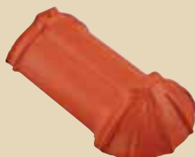
Ukončení hřebenáče nárožní dlouhé k hřebenáči č. 2