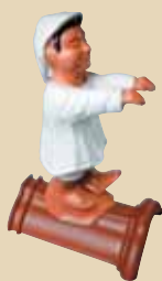
Náměsíčník na hřebenáči č. 2