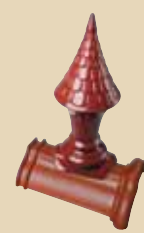
Věžička na hřebenáči č. 2