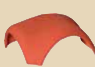
Rozdělovací hřebenáč valbový k hřebenáči č. 3