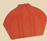
Ukončení hřebenáče spodní k hřebenáči č. 3