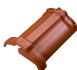
hřebenáč Tradition počáteční