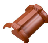
hřebenáč Tradition koncový