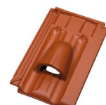
solární (průměr otvoru 60 mm)