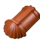
nárožní hřebenáč Tradition