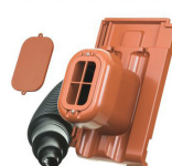
komplet odvětrání (průměr odvětrání 125 mm)