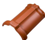
hřebenáč Tradition (spotřeba 3 ks/bm)